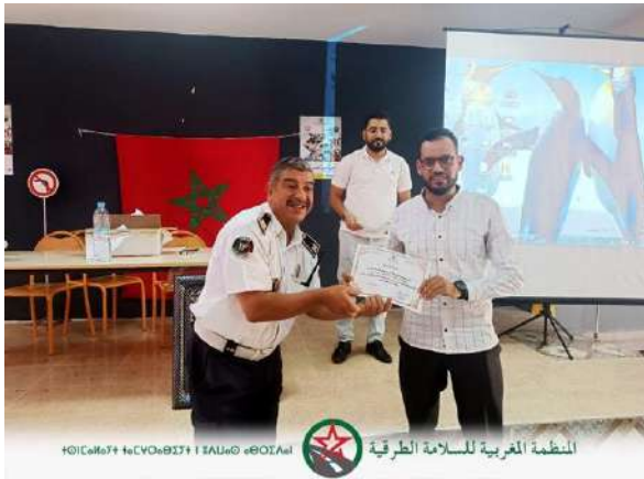
المنظمة المغربية للسلامة الطرقية