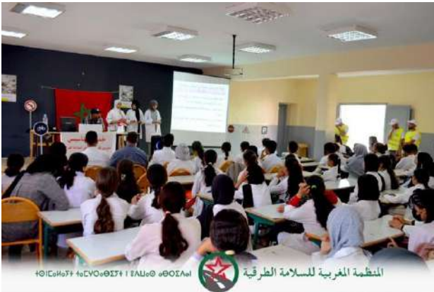
المنظمة المغربية للسلامة الطرقية