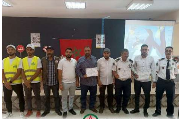
المنظمة المغربية للسلامة الطرقية