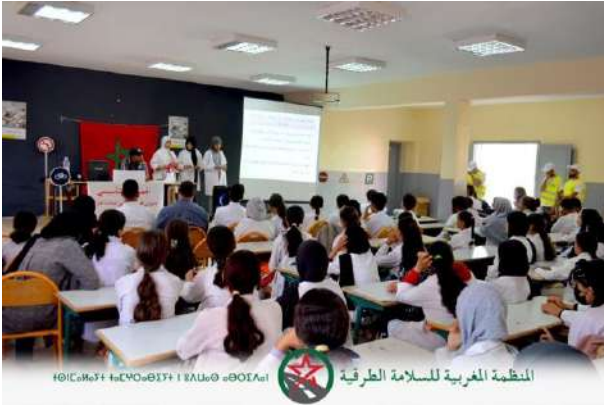
المنظمة المغربية للسلامة الطرقية