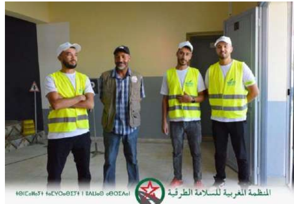
المنظمة المغربية للسلامة الطرقية