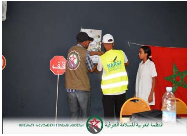
المنظمة المغربية للسلامة الطرقية